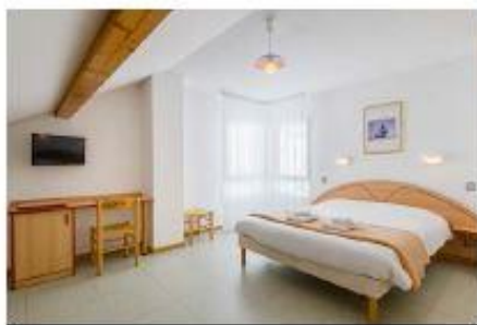
Exemple de chambre

880 m d'altitude - A 2 pas de la petite station familiale du Larcenaire - Village en pleine nature Superbe espace aquatique - Vue panoramique sur le Ballon d'Alsace - Riche patrimoine culturel