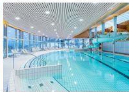
Piscine bien-être à l'espace aquatique