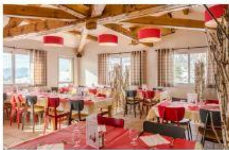
Salon de restaurant